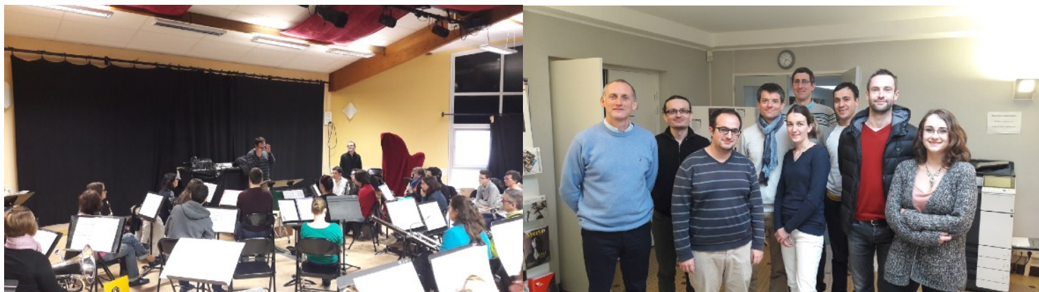
Orchestre d'Harmonie de Joué-lès-Tours et stagiaires, les 27-28-29 janvier 2017

☞ Téléchargez le dossier de présentation et pré-inscription