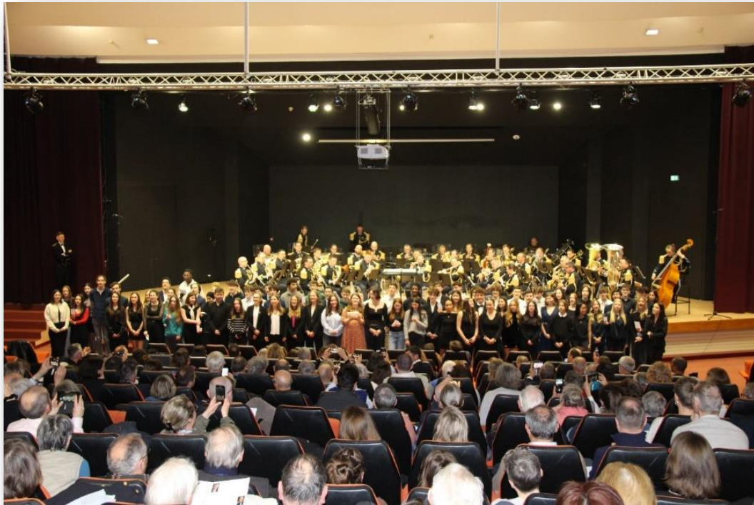
Élèves, Musique des Transmissions et public lors de l'édition du concert Jeunesse et Mémoire le 24 mars 2024 à l'Auditorium du lycée de l'Assomption, 18 rue Paul Painlevé, 35700 Rennes